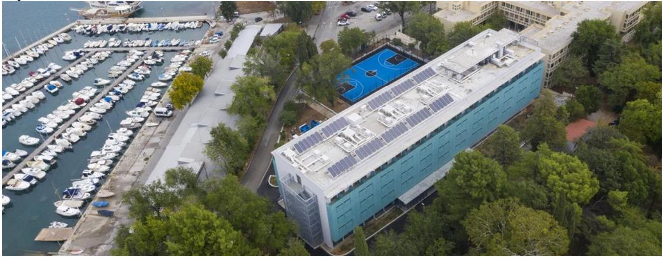
objekt Bruno Bušić